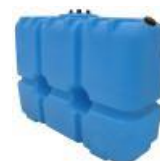
Дополнительный топливный бак (вынесенный)