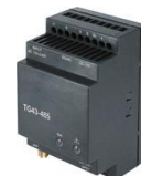
GSM/GPRS модем для контроля работы удаленных объектов