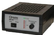
Зарядное устройство аккумуляторных батарей «Орион»