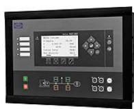
Контроллер с функцией параллельной работы электроагрегатов