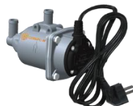
Электрический подогреватель охлаждающей жидкости «Северс-М»