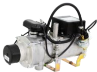
Подогреватель предпусковой дизельный «Теплостар»