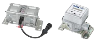
Система учета расхода топлива