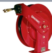
Катушка с топливными шлангами