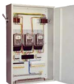
Шкаф с разъемами для подключения кабелей (устанавливается снаружи кожуха или контейнера)