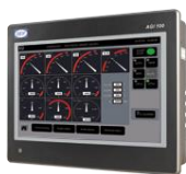
Панель дистанционного мониторинга и управления