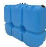
Дополнительный топливный бак (вынесенный)