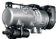
Подогреватель предпусковой дизельный «Webasto»