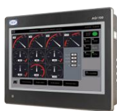
Панель дистанционного мониторинга и управления